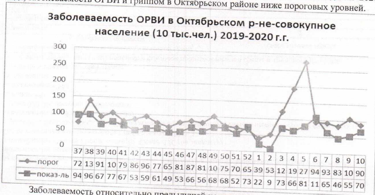
Заболеваемость ОРВИ в Октябрьском р-не-совокупное население (10 тыс.чел.) 2019-2020 г.г.

Заболеваемость относительно предыдущей недели увеличивается.