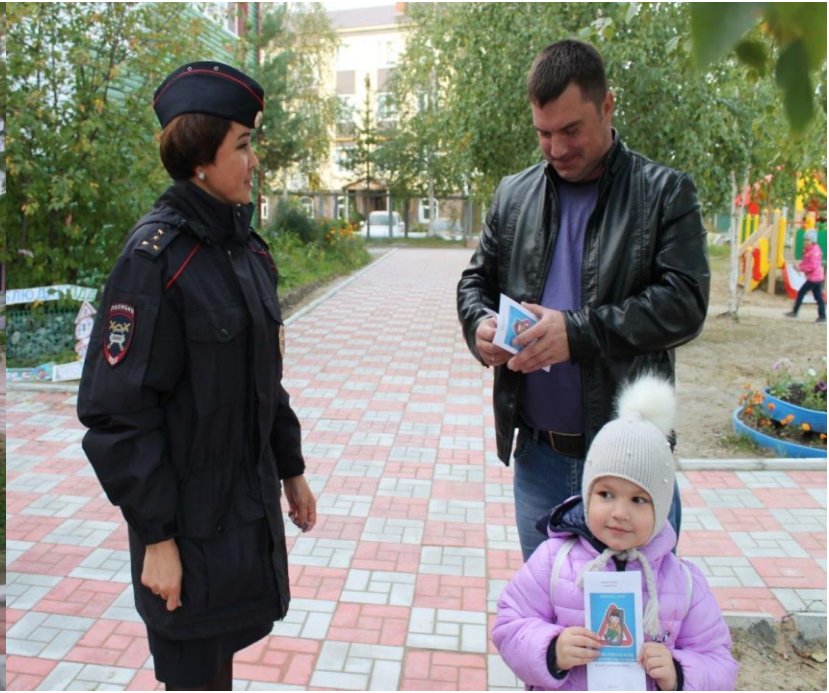
Акция «Безопасное кресло для ребенка».