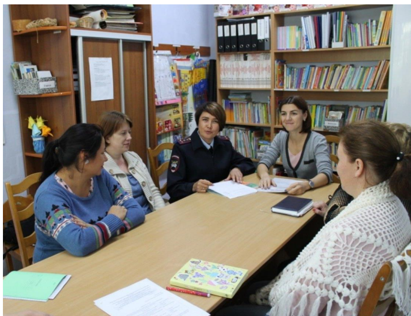
Общее родительское собрание «Безопасность ребенка-ответственность взрослого».