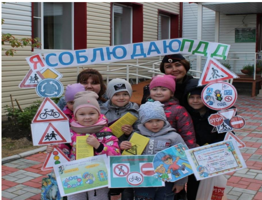
Педагогический час «Научите детей правилам дорожного движения на улицах родного поселка».